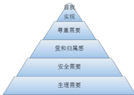
图2 马斯洛需求层次理论

需求层次理论反映在高校中层干部绩效考评体系表现为:爱和归属感、尊重需要和自我实现三个层次,生理需要和安全需要对于高校中层干部考评体系而言,是无意义的。想要实现高校中层干部职业发展目标,就必须发挥每个中层干部的积极性和主动性,通过绩效考评体系来督促干部干事、谋事、创业,发现工作中存在的问题和不足,为改进工作和实现自我发展提出意见建