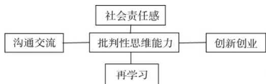
图1 当代大学生必备的思维能力体系

独立意识与创新精神并非是相互割裂的,二者间存在紧密的逻辑联系。一方面,独立意识是培养创新精神的前提条件。因为培养创新精神,需要将多种创造性思维结合起来进行训练,其中就包括了最为重要的独立思维和批判思维。另一方面,创新精神是独立意识的内在支撑。如果不能在创造性思维中表现出高度的创新热情和敏锐的洞察力,那么,独立意识必然放弃对所谓“惯性思维”的反抗,偶然蹦出的“灵感”可能会遭到无情扼杀。