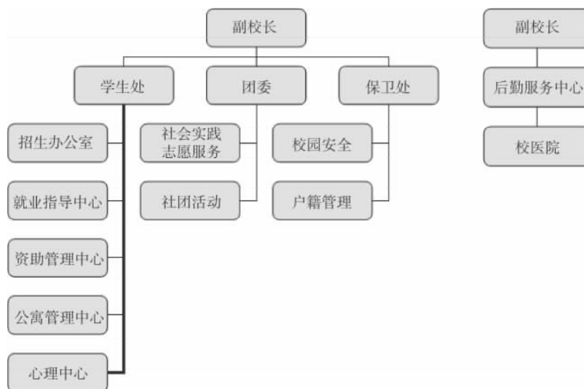
图3 南京财经大学学生支持服务机构图

服务)属于团委,保卫职能隶属保卫处,且不同部门分管的副校长也有所不同,具体组织机构如图3所示。